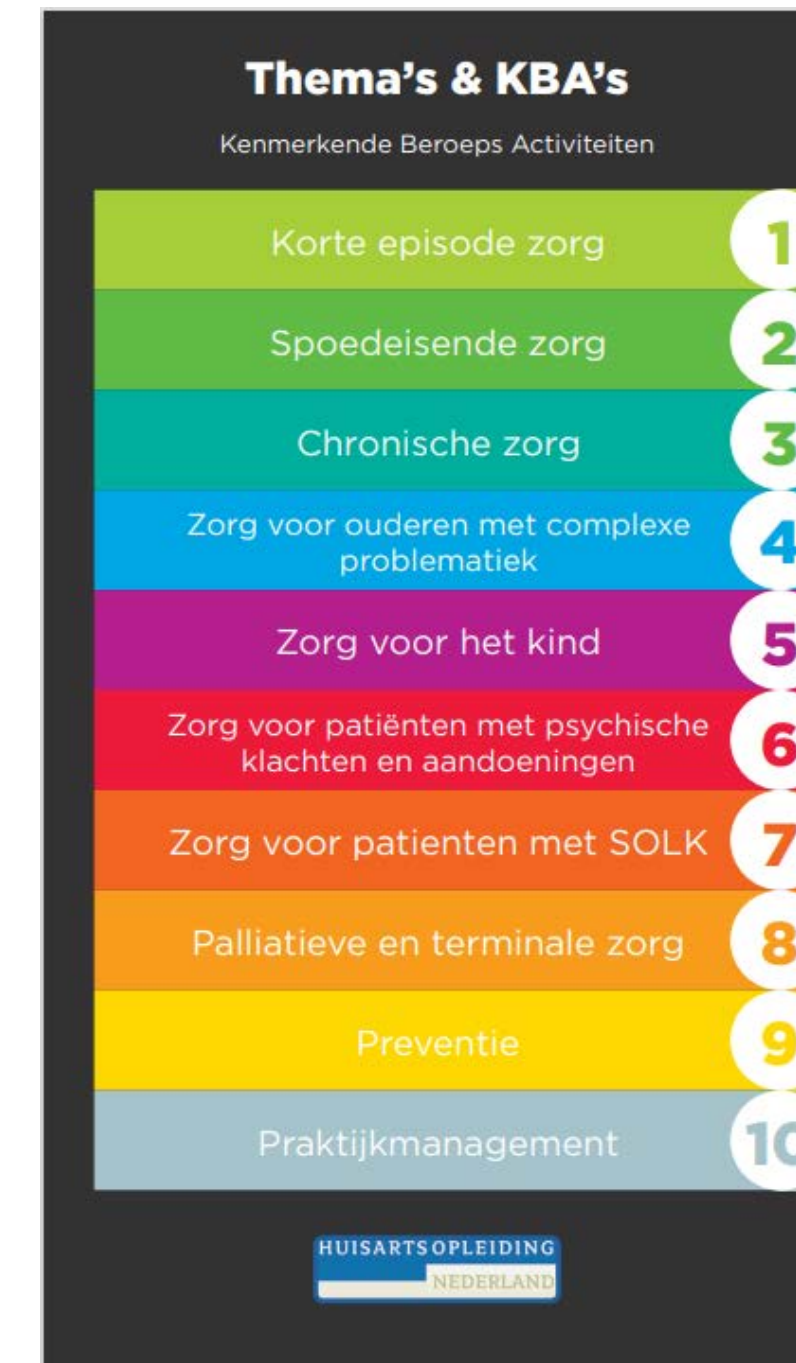
Afbeelding 2.

Bij elk thema wordt een aantal competentiegebieden uit het CanMEDS model concreet gemaakt in KBA's: kenmerkende beroepsactiviteiten. Enkele voorbeelden van thema's en KBA's die het meest expliciet over alcohol of verslaving gaan: